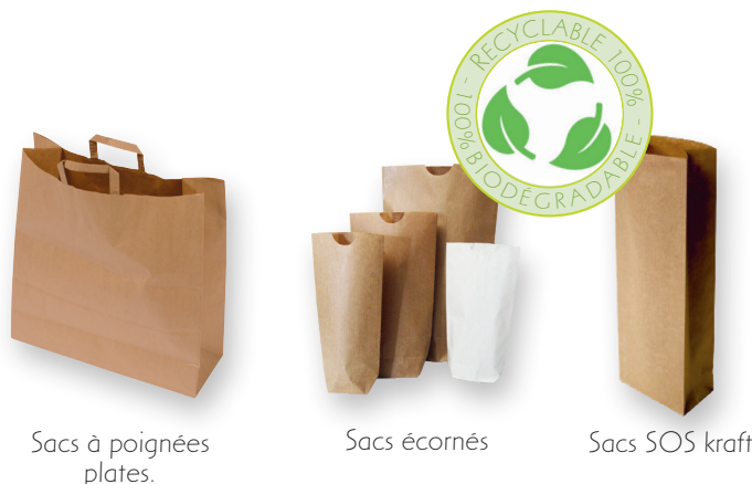
Sacs à poignées plates.

Nombreuses autres dimensions ou couleurs : nous consulter.