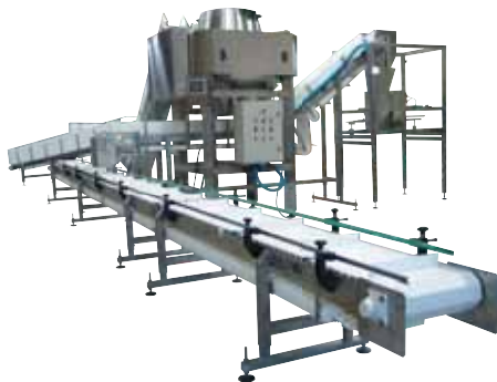
Pesage, mise en caisse et/ou répartition en barquettes de crevettes fraîches