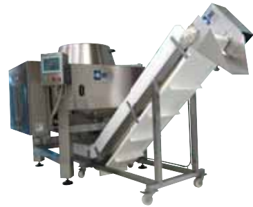
Comptage et conditionnement manuel de nems et raviolis surgelés