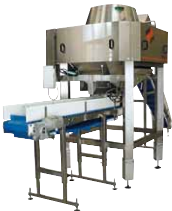
Pesage et conditionnement manuel de dés de viandes surgelés